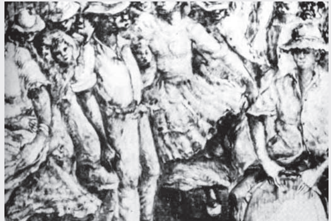
Grabado de la serie Baquiné , de José R. Alicea