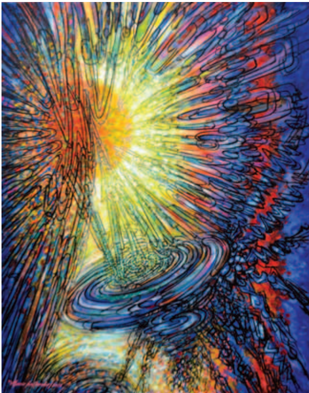
Vibración solar (2015)