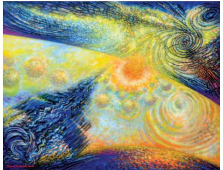
Macrocosmismo de Odrallag (2014)