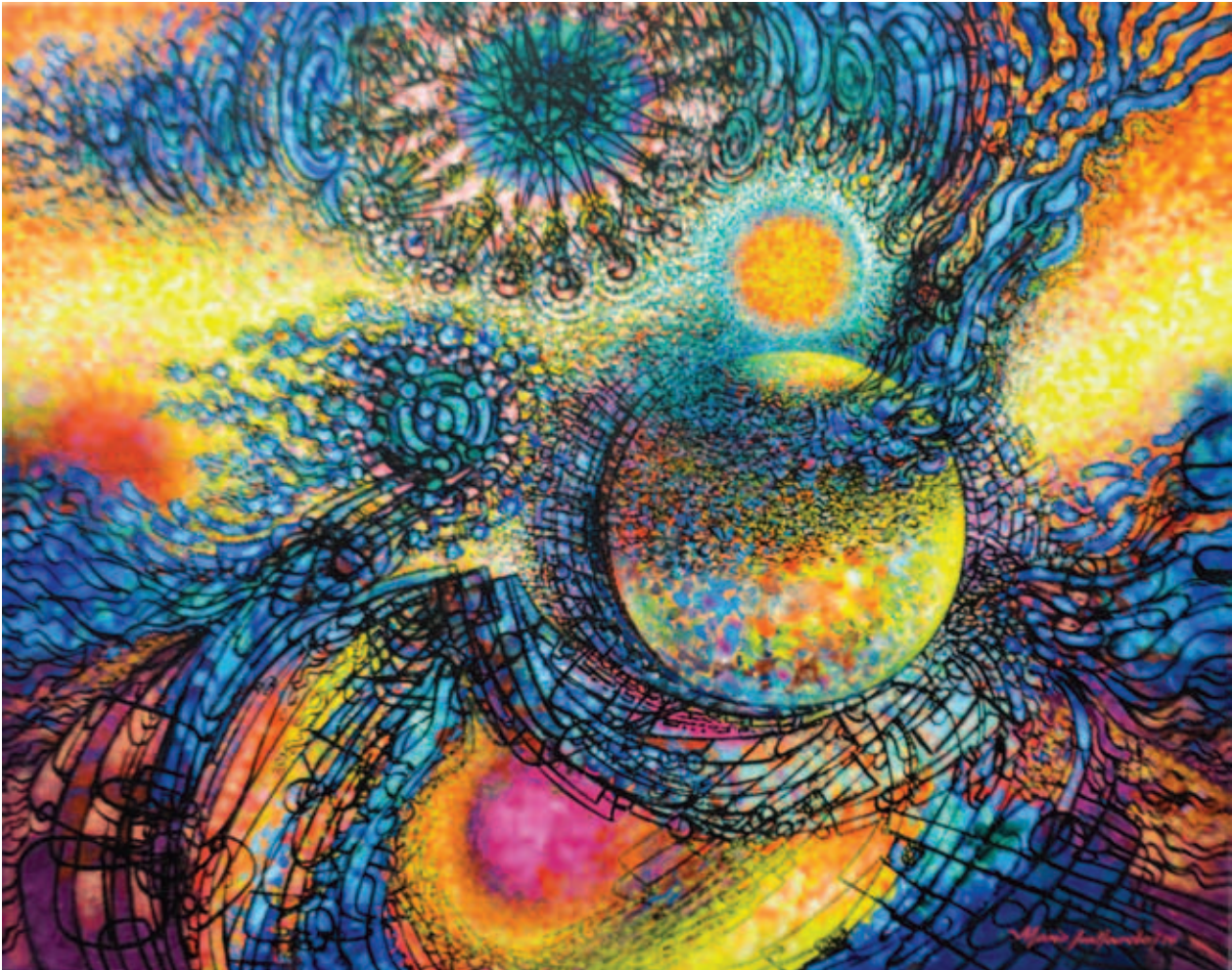
De arte fantástico (2014)