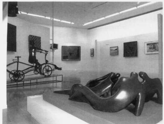
Exposición abierta Claves del Arte Museo Antropológico y de Arte Contemporáneo, MAAC, Guayaquil, Ecuador