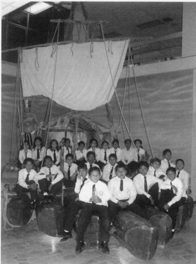
Museo Bahía de Caráquez, Manabí, Ecuador. Niños invitados por el programa Cultura para Todos del Banco Central del Ecuador