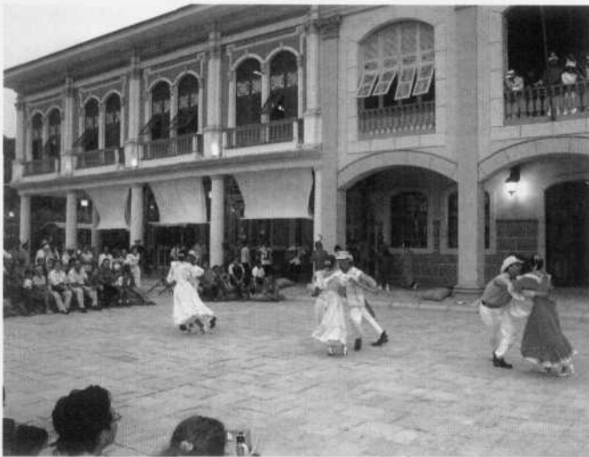
Parque Histórico Guayaquil Cantón Samborondón, Guayas, Ecuador