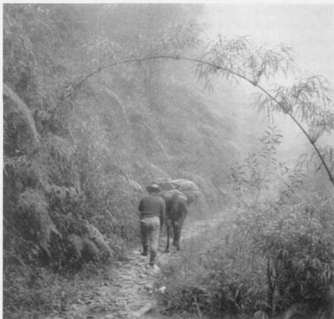
Puerta a la Amazonía, Napo, 1965