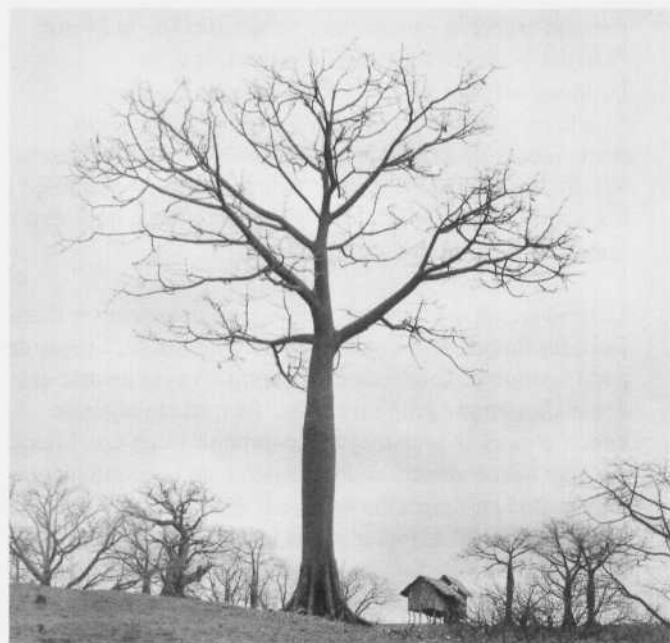
Ceibo gigante. Manabí, 1968