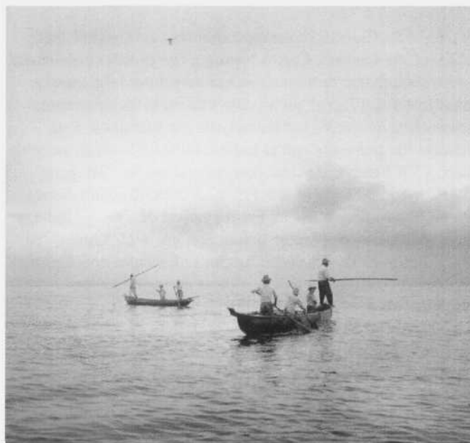
Pesca con arpón. Manta, Manabí, 1949

Rolf Blomberg (Suecia, 1912). Explorador, escritor, cineasta y fotógrafo. Corresponsal de guerra neutral, durante la Segunda Guerra Mundial. Realizó 33 películas documentales para la televisión y lideró expediciones para realizar largometrajes en Ecuador, Indonesia, Australia, Colombia, Brasil y Perú. Su producción incluye 20 libros y cientos de artículos para prestigiosas revistas como Life y National Geographic . Varios de sus libros fueron traducidos al español, inglés, polaco, checo, ruso, danés y noruego. El 75 por ciento de su producción tiene como protagonista al Ecuador, su cultura, su naturaleza y su historia. Fotos: Rolf Blomberg, Archivo Blomberg . Latin Web Editorial