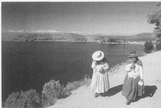
Lago Titicaca (Bolivia).