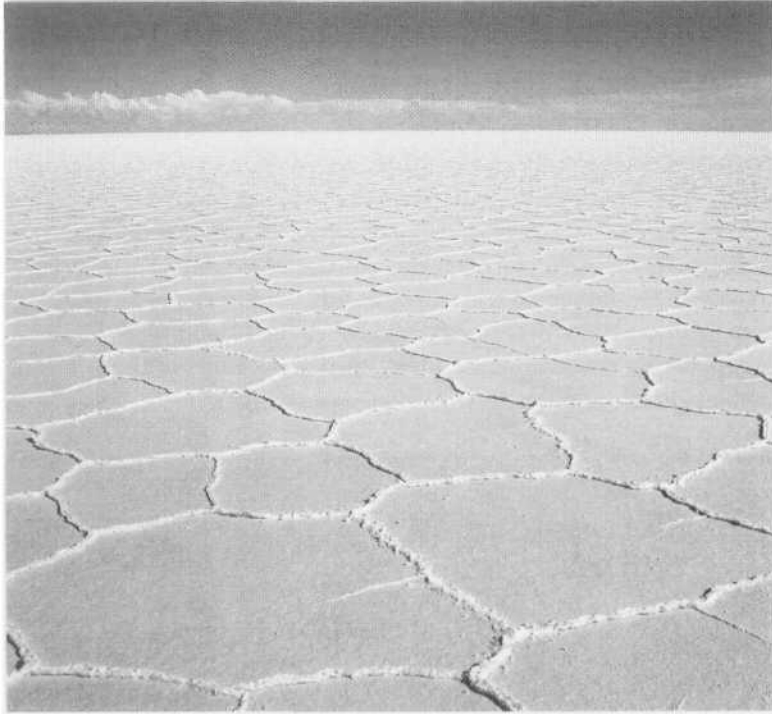
Desierto de Sal (Bolivia)

Arnade ha llamado “La guerra doméstica” 14 , que consistió en la lucha promovida por Pedro Antonio de Olañeta —comandante del Ejército Real del Alto Perú, de tendencia absolutista— contra las tropas leales al Virrey La Serna. La división de las tropas reales, que movieron ejércitos en todo el Alto Perú, debilitó aún más la posición realista, que así tuvo que enfrentarse a los ejércitos bolivarianos en Junín y posteriormente en Ayacucho. Estos hechos fueron acompañados de una total crisis de autoridad por parte de la principal instancia administrativa y gubernamental en el Alto Perú, la Audiencia, y de una gran debilidad política del virreinato arrinconado en el Cusco. A esto se sumaba la falta de dinero para mantener las tropas y el descontento de los cabildos y las comunidades indígenas por tener que solventar los gastos de un sistema que perdía legitimidad.