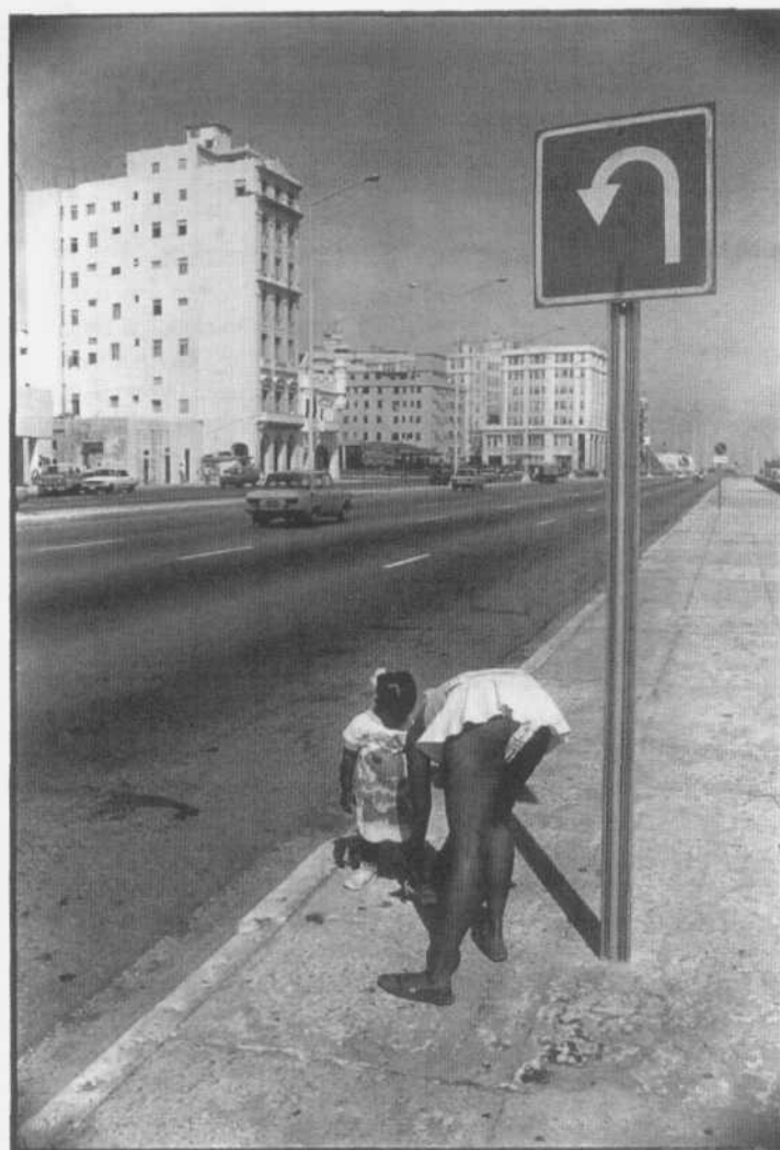
Siga la flecha. La Habana, 1994

Tito Álvarez (Las Tunas, 1916). Nombre profesional del fotógrafo cubano José González Álvarez. Ingresó en el Club Fotográfico de Cuba en 1951, donde estudió fotografía, dedicándose por completo a esta actividad desde 1962. Su colección de fotografías titulada Gente de mi barrio obtuvo el Premio Fotografía Cubana de 1982, además de otros importantes premios en concursos nacionales.