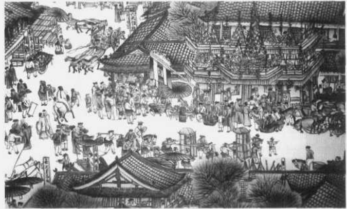
Qing Ming Shang He Tu (rollo de la d. Song 1119-1279) s. XII

La escuadra partió de China hacia Calicut, pasando por Malaka, y de allí se dirigió a Sofala (en el sur del África oriental). Veamos el recorrido de las cuatro escuadras 16 .