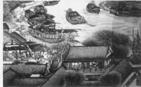
Qing Ming Shang He Tu (rollo de la d. Song 1119-1279) s. XII