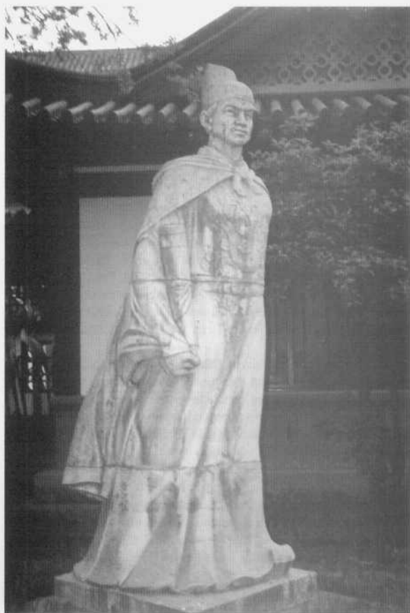
El almirante Zheng He.

Es decir, como fruto de un espejismo muy particular, la cultura, la ideología y la filosofía europea Ilustrada producirá una triple “fabricación teórico-interpretativa” de la historia, la realidad objetiva