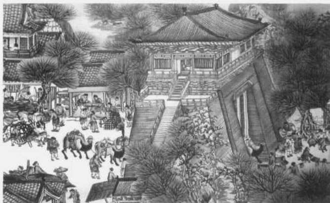
Qing Ming Shang He Tu (rollo de la d. Song 1119-1279) s. XII

en el mapa Vinland 17 ), pero igualmente toda la costa del norte de la actual Rusia (con extrema precisión desde Noruega hasta Siberia en el mapa de Waldseemüller de 1507 18 ). Regresaba a China en noviembre de 1423. Las dos restantes escuadras que se separaron en las islas del Cabo Verde siguieron la ruta del Atlántico sur (siempre impulsados por las corrientes marinas y los vientos exclusivamente).