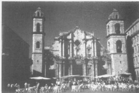
Catedral de la Habana