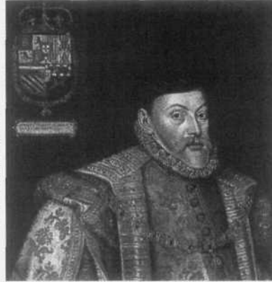
Fig. 1 Felipe II, hijo de Carlos V, quien, en nombre de su padre expidió la cédula de creación de la Universidad de 1551.

franciscanos y jesuitas, que en su afán evangelizador fueron los que iniciaron la conquista espiritual y cultural con la apertura de los colegios para los naturales y para los hijos de los vencedores.