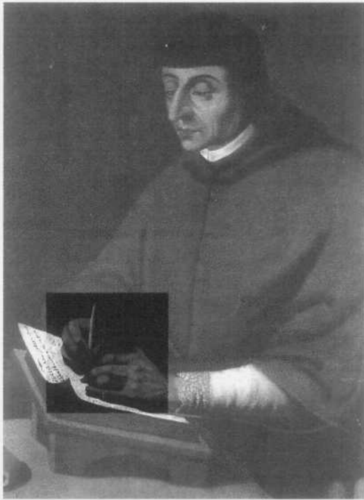
Fig. 3 Don Francisco Cervantes de Salazar (1518-1575), primer catedrático de la Universidad de México.

La diferencia en fechas de expedición de la cédula, de fecha de septiembre 1551, con la de apertura de la Universidad, en junio de 1553, posiblemente se daba la tardanza de las comunicaciones en aquellos tiempos. Baste recordar que el primer viaje de Colón para atravesar el Atlántico se llevó más de 3 meses.