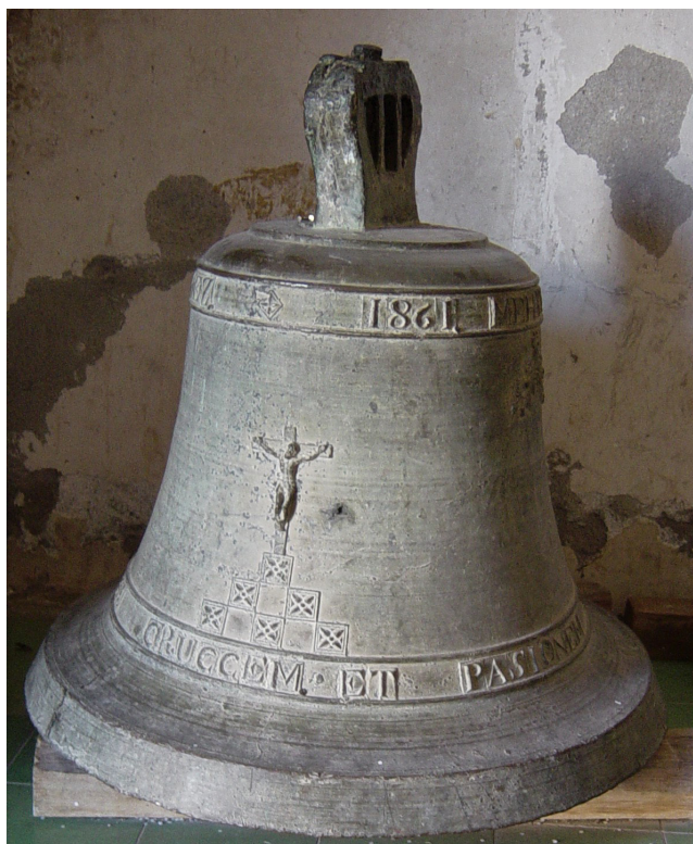
Figura 2. Campana de San Pablo Güila con la imagen del Señor de Chihuitán.

eso nunca ocurrió, por lo que tuvieron que contentarse y considerar a los de Güila como sus mejores amigos. 10