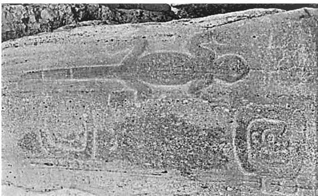
Figura 6. Imagen de una lagartija esculpida en un monolito de Huamelulpan, en la región Mixteca Alta

lla en el trabajo de Rebollar y Sanjuan (2006: 62-65) no queda duda que se trata del numen de la lluvia y el rayo quien se llevó el badajo al lugar de donde fue sustraído, es decir, el Pueblo Viejo o cabecera del antiguo señorío zapoteco. Si el planteamiento de Carreón (2020: 12) es correcto, y “en los casos donde sólo había un bronce, todas las virtudes que se asociaban a los diferentes sonidos se le atribuían al mismo” se tendría evidencia fehaciente que los frailes de Oaxaca sobrepusieron las funciones del instrumento para reforzar las creencias en torno a Cocijo y proteger los campos y asentamientos indígenas.