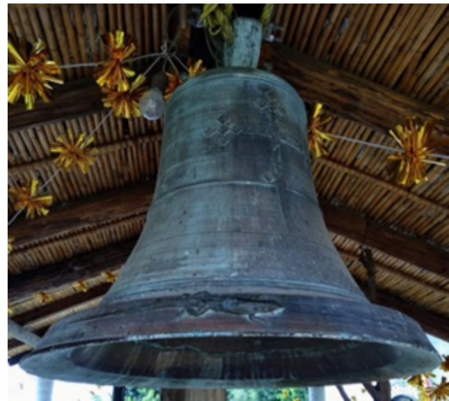
Figura 4. Campana de San Baltazar Chichicapan

donde ahora está la escuela de música [...] Los rayos que cayeron sobre el techo de la iglesia eran secos, por eso las personas no pudieron apagar el fuego con agua común, sino que tuvieron que utilizar agua con sal. Un aspecto sumamente significativo es que a Santiago se le considera ‘hijo del Rayo’ (Id: 165).