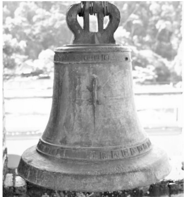
Figura 3. Campana de Santiago Xanica.