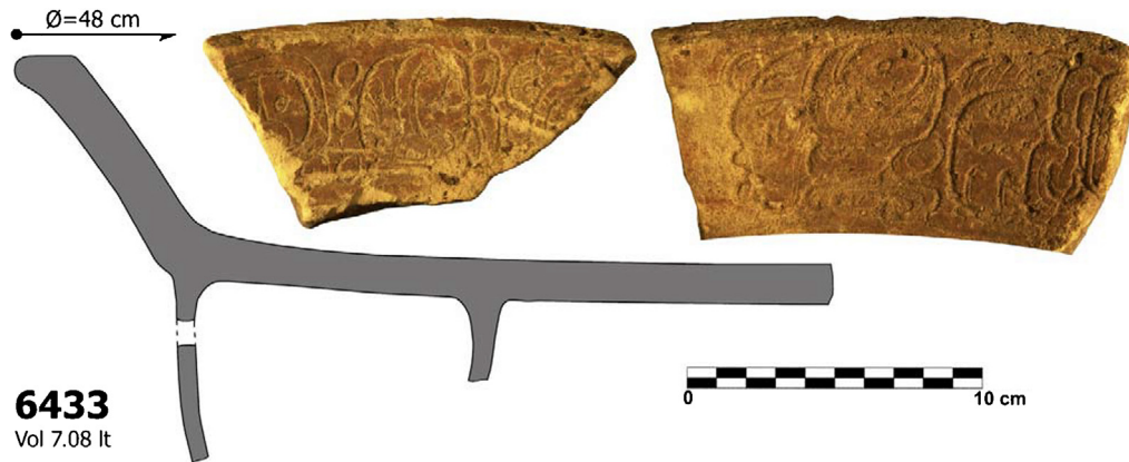
Figura 3. Fragmento de vasija con glifos en Chinikihá que posiblemente sirvió para servir tamales. (Modificada de Mirón Marván, 2012, p. 347, figura 7).

animales eran altamente procesados y que la carne estaba siendo removida del esqueleto para su consumo directo o bien, para su utilización en otras formas de preparación, incluyendo en cocidos o sopas y en platillos con maíz, como los tamales. A manera de comparación, la proporción de restos de perro que presentan marcas de corte se encuentra alrededor del 5%, por lo que suponemos que estos animales al ser de tamaño pequeño, se cocinarían completos o mínimamente desmembrados dentro de un horno semi-subterráneo llamado “ pib ” (Montero, 2011). No descartamos que algunos venados hayan sido desmembrados y cocidos en hornos también, al igual que los tamales también pudieron ser cocidos en hornos (O’Connor, 2000).