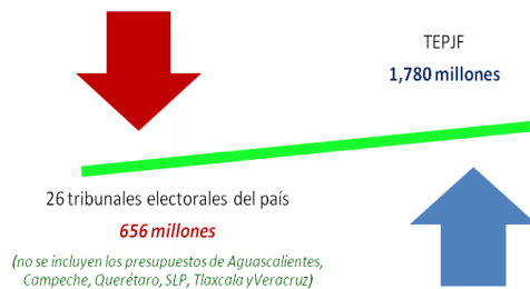
Cuadro no. 2 Presupuestos tribunales locales vs TEPJF por año estimado

* Para la elaboración del presente cuadro se tomó como referencia la misma fórmula anterior (PGA), se sumaron los presupuestos de los años 2008, 2009 y 2010 y se dividió entre tres para obtener un porcentaje medio anual.