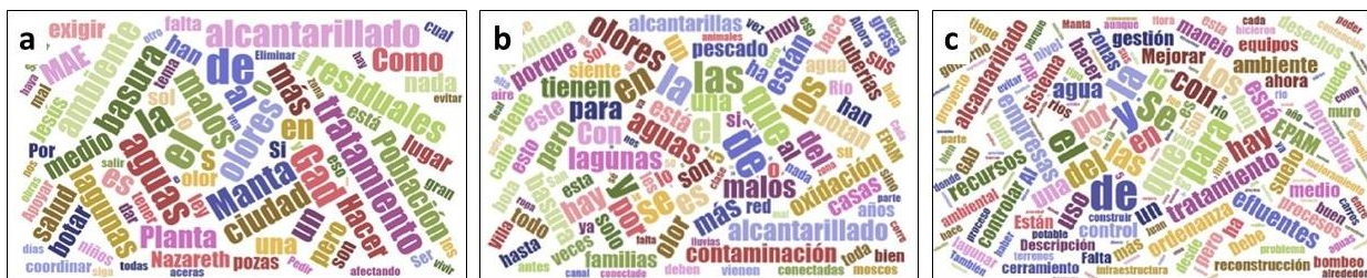
Figura 2. Nube de descriptores semánticos de las encuestas realizadas a los distintos actores involucrados en la problemática de la PTAR El Gavilán. figura 2a. componente social; figura 2b. empleados de PTAR y figura 2c. funcionarios públicos de la EPAM. Word Cloud Generator (Davies, 2023)

La nube semántica permitió identificar la opinión de la comunidad. Se aprecia que el principal problema de la comunidad son los malos olores, el tratamiento aguas residuales, alcantarillado y basura. Sin embargo, se reflejan otros términos que puedan denotar preocupación por la salud y el medio ambiente (Figura 2a). Las encuestas dirigidas a los empleados de la PTAR destacan los temas de alcantarillado, tratamiento de las lagunas de oxidación y la responsabilidad ciudadana ante la contaminación con basura, adicionando los términos de pescado y grasa; a igual que el grupo anterior (Figura 2b). En cuanto a las encuestas dirigidas a los funcionarios de la EPAM la constante es alcantarillado y tratamiento, también se hicieron evidentes otros elementos técnicos como: ordenanzas, recursos, manejo, control, proyectos, normativa, procesos, suelo, gestión; es decir, factores que pueden afectar el desempeño óptimo de la PTAR (Figura 2c).