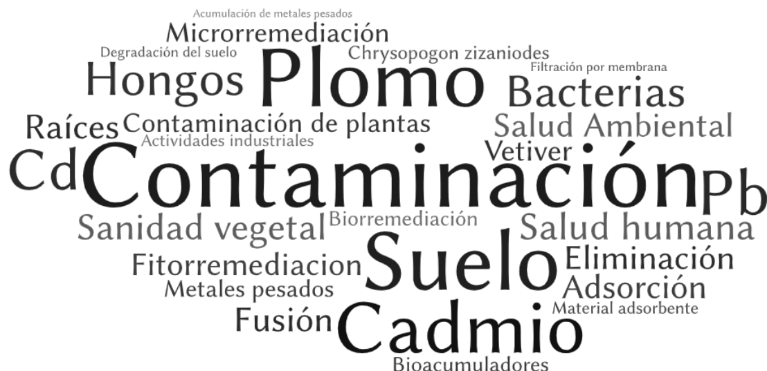
Figura 2. Nube de palabras de los términos más frecuentes en los estudios.

En la nube de palabra anterior (Figura. 2), fue posible notar términos destacados como contaminación, seguidos de los demás: suelo, cadmio, hongos, bacterias, plomo. Por lo tanto, hubo una mayor frecuencia de estos términos en el corpus textual de los estudios identificados y seleccionados en la literatura para componer la revisión.