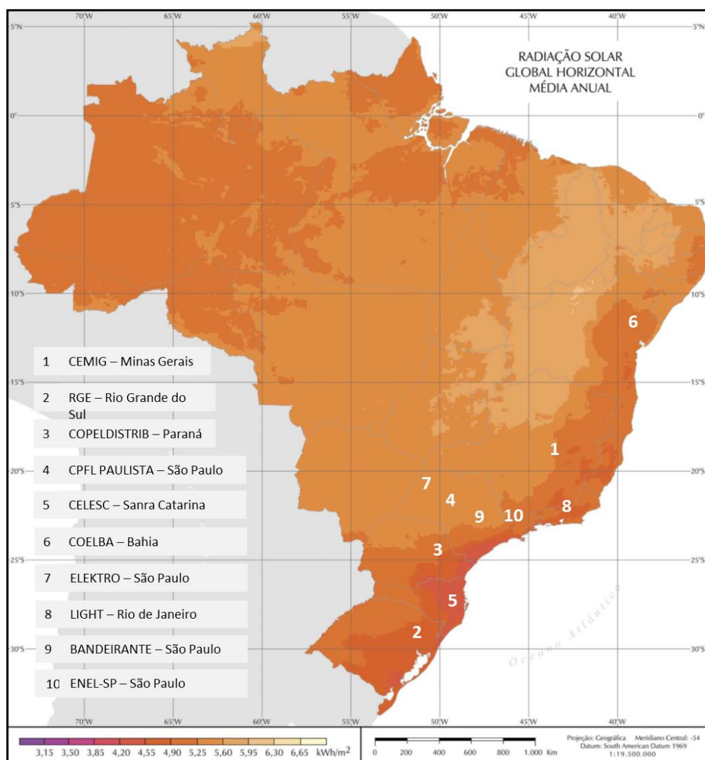
Figura 5. Mapa de radiação solar com localização das 10 principais distribuidoras brasileiras.

inseridas duas informações no simulador: a primeira informação foi a potência instalada acumulada até o final de 2020 de cada distribuidora; a outra informação, foi a localização da distribuidora. A localização define a quantidade de radiação média que incide no local, e no Brasil, essa radiação média sofre grande variação, como pode ser observado na Figura 5. É importante destacar que para uma análise de geração mais precisa é necessário utilizar um software que leve em consideração outros parâmetros como localização de satélite, inclinação dos módulos fotovoltaicos e desvio azimutal.