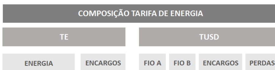
Figura 3. Composição da tarifa de energia para o Grupo B.

A TUSD FIO A é a componente referente aos custos do sistema de distribuição ou de transmissão de terceiros, como o uso dos sistemas de transmissão de rede básica. A TUSD FIO B é referente aos custos de prestação de serviço da distribuidora de energia, como remuneração dos ativos. A TUSD ENCARGOS são os custos relacionados aos encargos do serviço de distribuição de energia elétrica, como a Reserva Global de Reversão. A TUSD PERDAS são os custos relacionados as perdas no serviço de distribuição de energia, como as Perdas técnicas do sistema da distribuidora. A TE são os custos relacionados a compra da energia por parte da distribuidora, como a geração de energia. A TE ENCARGOS são os custos relacionado aos da parcela TE como Encargos de Serviços de Sistema.