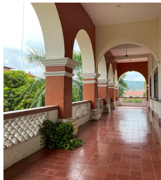
El edificio para oficinas federales, estatales y municipales de Apatzingán se identificó como obra de Le Duc gracias a una placa en el sitio.

Aunque se reconocen los riesgos de atribuir autoría por analogía con edificios que se sabe son de un arquitecto, es posible apuntalar hipótesis de autoría cuando la evidencia es débil. Está pendiente, desde la disciplina, mayores propuestas metodológicas detalladas para la adjudicación de autoría por este medio; sin embargo, para el caso de Le Duc la lectura directa de algunos edificios sugiere su participación en el diseño. El primero de ellos es la reconstrucción de la Casa de la