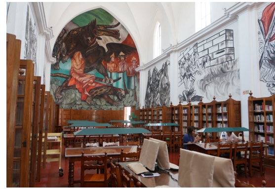
Le Duc realizó varias obras de rehabilitación de monumentos históricos, incluida la conversión del Santuario de Jiquilpan en la Biblioteca "Gabino Ortiz".

Otras obras urbanas en que participó Le Duc fueron la fuente de la Plaza de don Vasco en Pátzcuaro que estaba adornada con esculturas de pescados, que muy probablemente fue diseño suyo, pues reportó al presidente: "Proyecto y presupuesto Fuente Monumental se encuentra en poder Corl. [sic] Núñez también se espera acuerdo". 50 Parece haberse encargado también de diseños de pedestales para las esculturas de