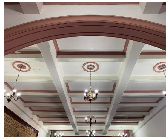
Plafón de la Casa de la Constitución en Apatzingán.

Estas similitudes no son contundentes, pues el trabajo de las vigas de concreto a manera de vigas de madera era común en la época. Lo que llama la atención es la forma en que se confronta una propuesta regional de arquitectura típica en los edificios de Le Duc con este preciosismo en los plafones, una contradicción particularmente visible en el Hotel Palmira, pues la planta alta tiene cubierta de vigas con tapa de ladrillo de barro y la estructura de madera sobre él. Igualmente, el aspecto tradicional de la casa de los Cárdenas en Jiquilpan —en su exterior y en el patio interior— contrastan con los fastidiosos plafones interiores.