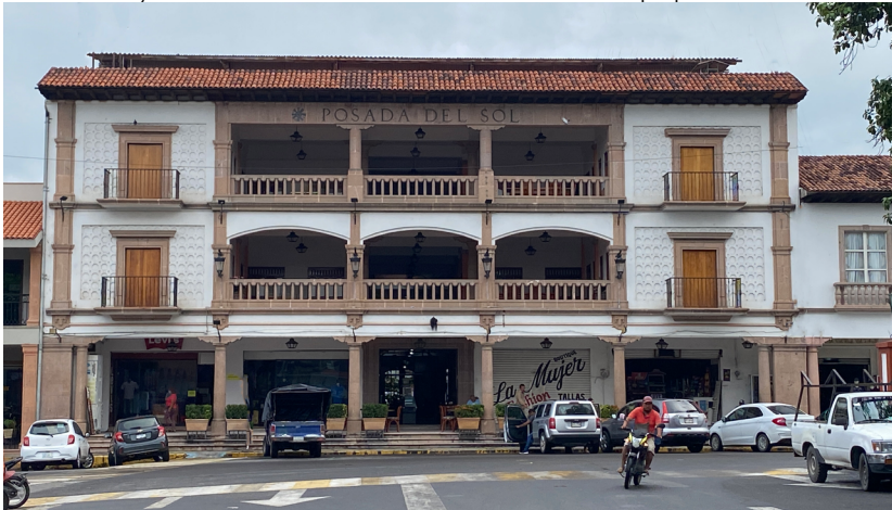
El Hotel Posada del Sol en Apatzingán.

El Hotel Posada del Sol en Apatzingán presenta a su vez varias similitudes con el Hotel Palmira de Jiquilpan. Aquí la tesis es más débil; se sabe que Le Duc estaba en Apatzingán en la época de la construcción, pero no hay mayores datos sobre la obra. Llamen la atención tres cosas: la composición general de la fachada con dos volúmenes sólidos flanqueando un hueco; la calidad espacial de la gran terraza al frente, la estructuración con concreto armado simulando madera, y el diseño de los barandales retoma un motivo del Palacio Huitziméngari, edificio del siglo XVI, en Pátzcuaro. Referente a la composición general, cabe mencionar que es una fórmula muy socorrida en la arquitectura clásica, sobre todo a partir de las villas palladianas . No obstante, es de notarse que fue utilizado por Le Duc en el Teatro Emperador Caltzontzin, en la Quinta Eréndira en Pátzcuaro y en el Centro Recreativo El Casino en Jiquilpan.