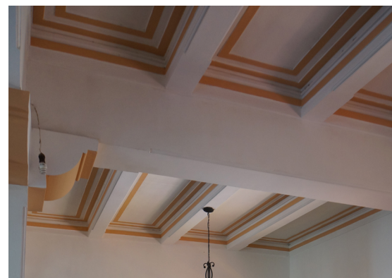
Plafón en el restaurante del Hotel Palmira en Jiquilpan.