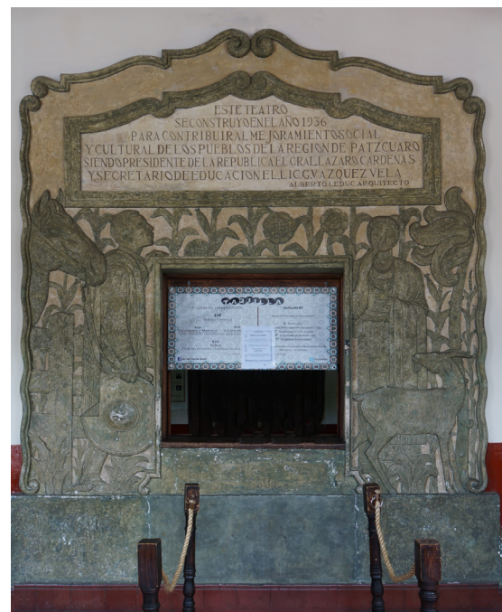
El Teatro Emperador Caltzontzin tiene una elaborada inscripción autoral en la taquilla.