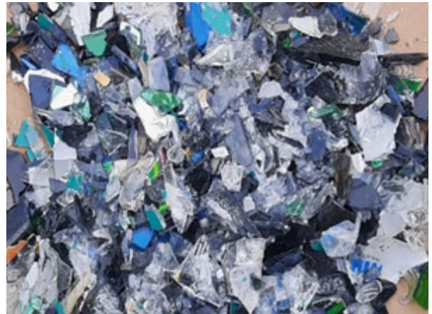
4. Triturado manual del vidrio.