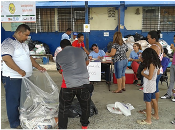
1. Recolección de la materia prima.