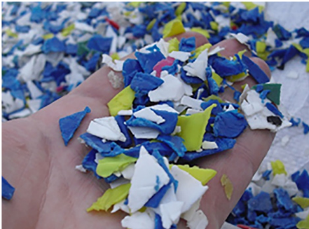
3. Triturado manual del plástico.