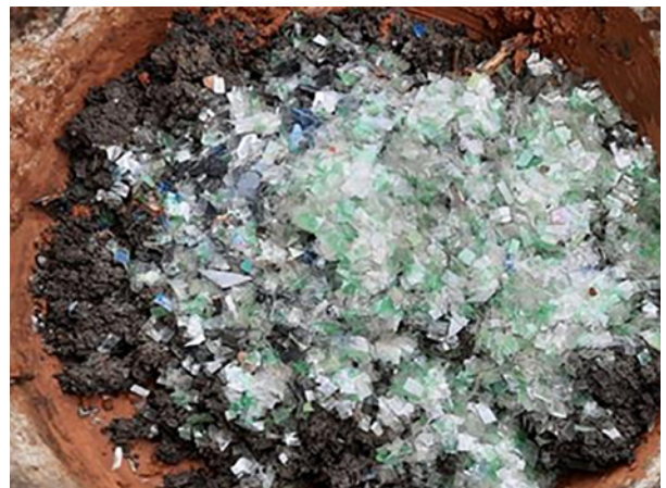
6. Incorporación en la mezcla.