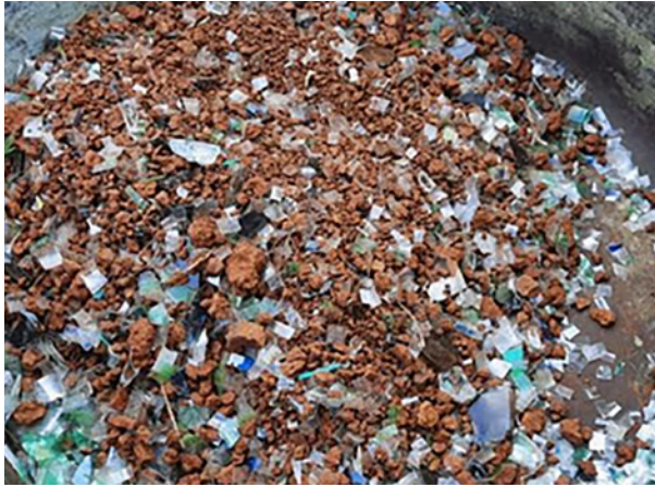
7. Mezclado manual.