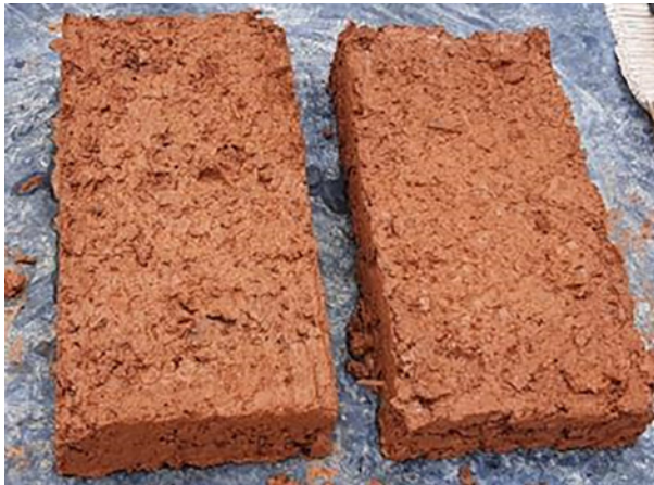
9. Secado al aire libre.