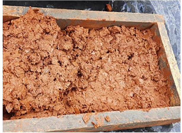
8. Vertido en el molde.