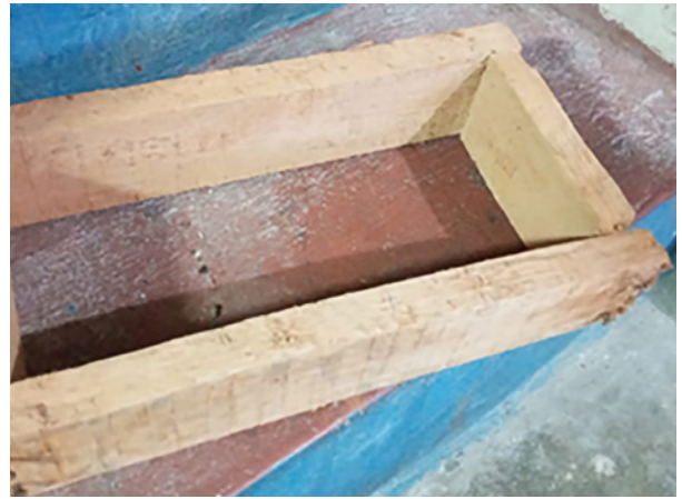
2. Elaboración del molde.