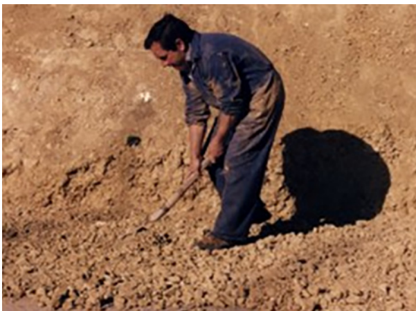
5. Extracción y preparación manual del barro.