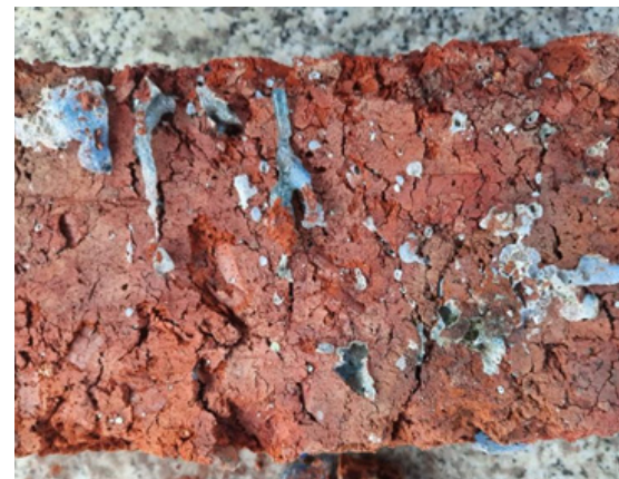
Resultado de prototipos.

Adobe. Tierra a la que se arranca cuidadosamente todo tipo de impureza. Masa de barro moldeada en forma de ladrillo y secada al sol. Ladrillo formado por una masa de tierra arcillosa, agua y algún aditivo, secada al sol y al aire. El término “adobe” deriva del vocablo árabe al-tub , que se refiere a una especie de ladrillo elaborado con una masa de barro hecho de arena o arcilla, la cual es mezclada con paja para luego darle forma de ladrillo y, posteriormente, puesta a secar al sol; estos ladrillos hechos de adobe eran utilizados para la edificación de paredes y muros. 11