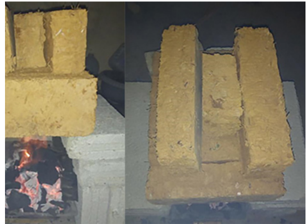
10. Horneado. Fotografías: NC, 2020.

Se realizaron tres lotes de producción de ladrillos, en cada uno de los cuales se elaboraron los tres prototipos con la cantidad necesaria para cumplir con las normativas correspondientes, como se detalla en las tablas 1, 2 y 3.