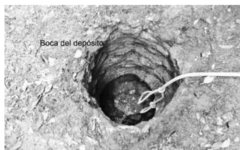
Nakbé: boca del depósito después de la excavación, operación 730.

obsidiana, fragmentos de estuco, bastante carbón y varios huesos de aves y roedores). Los entierros así como los restos culturales estaban colocados encima de un nivel compacto de tierra café con carbón y ceniza. En los niveles mas profundos, debajo de los entierros, se descubrieron tres muros de bloques de piedra caliza paralelos con una separación entre si de 0.50 m con cerámica utilitaria, siendo en su mayoría fragmentos de cántaros de grandes dimensiones con una temporalidad para el período Preclásico Tardío (300 a. C. - 150 d. C.) (Balcarcel, op. cit. ). Este depósito posee una secuencia de ocupación y variedad de uso desde el Preclásico Tardío hasta el Clásico Tardío (350 a. C. al 900 d. C.).