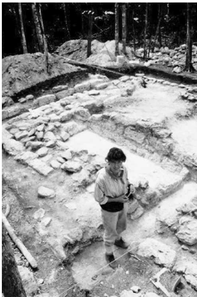
Residencia preclásica asociada al depósito excavación realizada por la arqueóloga Beatriz Balcarcel. Fotografía: R. D. Hansen, 1998

El depósito de Nakbé cumplió con varias funciones a lo largo de su vida útil. Se descarta el uso de aljibe por carecer del enlucido de estuco en las paredes, aunque se descubrieron algunos fragmentos, los mismos no pertenecían a las paredes. Sin embargo, si funcionó como depósito para agua, pero en recipientes de cerámica utilitarios (cantaros), los cuales fueron colocados al fondo del depósito y separados por los muros mencionados. Cabe la posibilidad de que algunos pudieran ser alternados para guardar también granos como se ha mencionado en los ejemplos anteriores. También fue un recinto mortuorio para ini-