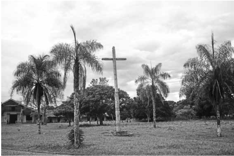
Plaza de Santa Ana, la cual no ha sido alterada. Se aprecian en el centro las cuatro palmeras.