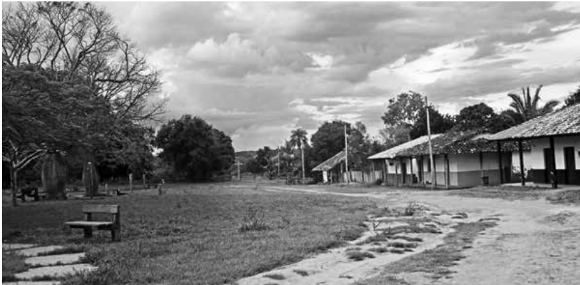
Entorno urbano de Santa Ana. Fotografía: KMC, 2008

4. Establecimiento de un régimen institucional organizativo y administrativo descentralizado con fuerte presencia y participación social.