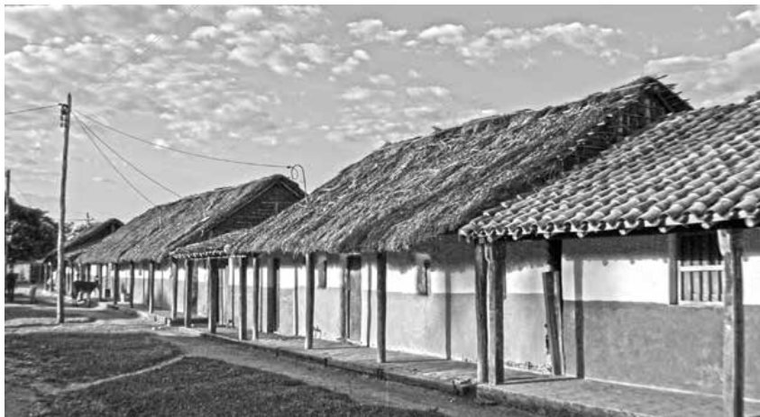
Viviendas adosadas, con la misma tipología en el eje conductor al templo de Santa Ana. Predomina el uso de materiales como tierra en los muros y paja en cubierta.

De manera transversal a este eje de pertenencia, surgió el eje del misterio y de la sacralidad, uniendo los principales elementos de la reducción con el núcleo vital: la plaza y el conjunto religioso. Las procesiones religiosas determinaron la presencia de elementos urbanos que definían a la misión: “El recorrido comienza en el acceso principal al pueblo, corporizado por lo general por otra capilla denominada Betania, desde el cual se conecta con la plaza, hasta encontrar la cruz central, de ésta sigue linealmente