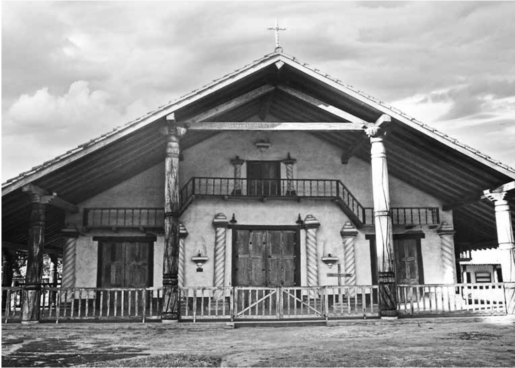
Iglesia de Santa Ana. Fotografía: Karina Monteros Cueva (KMC), 2006

que garantizará los derechos de los indios reducidos, y la predicación del evangelio en orden a la formación de comunidades indígenas cristianas” (Lasso, Isidro, 2010: 75).