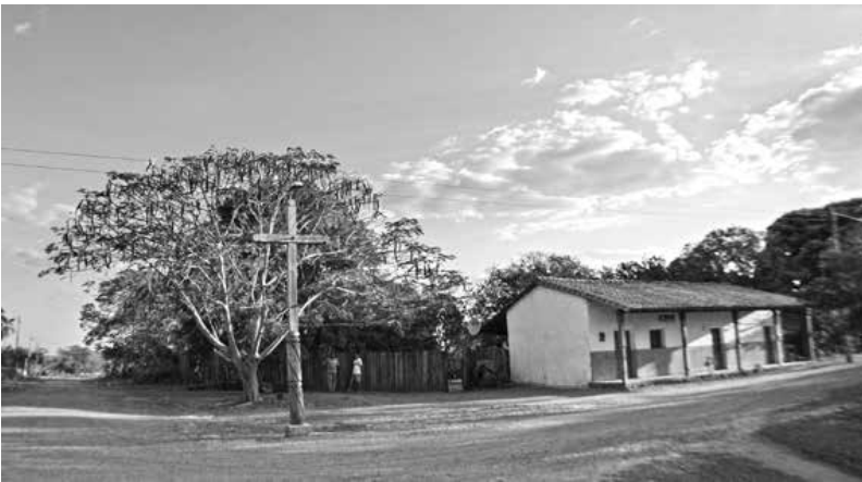
Cruces de madera en las esquinas del camino procesional.

bién llamados portalería— se encontraban las viviendas. Aún en la actualidad, las cruces marcan el sentido procesional de las vías donde la Capilla de Betania, es el inicio de recorrido en las jornadas religiosas arraigadas en los pobladores.