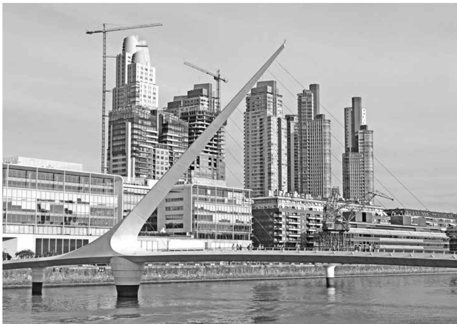
Torres en Puerto Madero, Buenos Aires. En primer plano, el Puente de la Mujer, de Santiago Calatrava, inaugurado en diciembre de 2001. Fotografía: ISM, noviembre de 2012

en Uruguay, o la costanera de Guayaquil, en Ecuador, o como lo han hecho en otros sitios en Latinoamérica. En contraste, muchas de las torres de la zona de Puerto Madero se nos llenan de agua a causa del viento húmedo por las Sudestadas, 9 pues no poseemos ni la precisión ni las tecnologías, ni las posibilidades económicas de otros contextos internacionales. Entonces, “muy inteligentes, pero muy tontos”, pues en lugar de resolver bien nuestros problemas con los limitados recursos que tenemos, utilizamos recursos de otros, pensando que estamos allí, cuando en realidad estamos aquí. Lo sustentable para mí, consistiría en iniciativas para recuperar