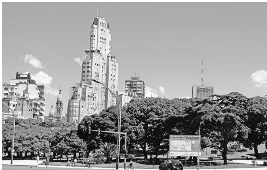
Vista de la plaza San Martín, con el edificio Kavanagh al fondo, construido en 1935, en el centro de Buenos Aires, Argentina. noviembre de 2012

— Cierto, además la Argentina posee una gran tradición hemerográfica y bibliográfica.