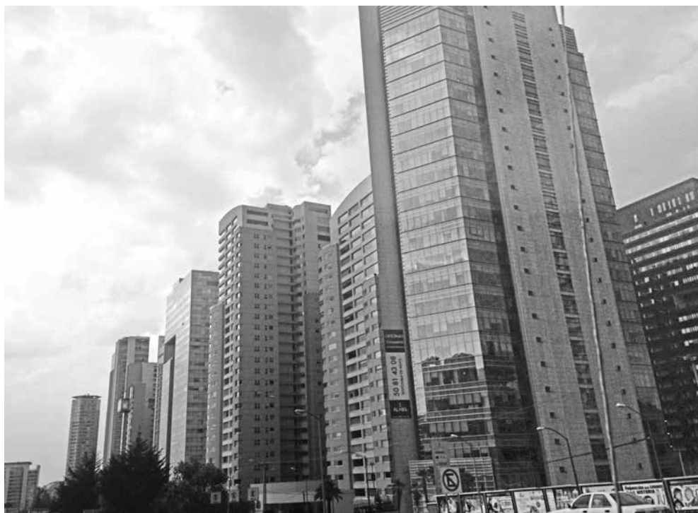
Vista de oficinas y apartamentos en la zona de Santa Fe, Ciudad de México, 2013