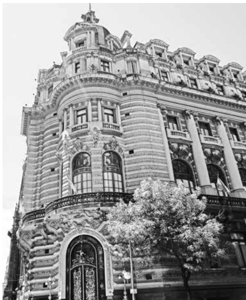
Edificio del Centro Naval, de 1914, Buenos Aires, Argentina Fotografía: ISM, noviembre de 2012.