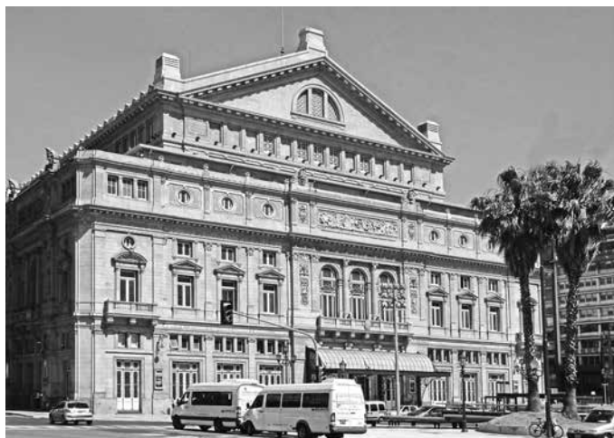
Teatro Colón, 1880-1908, en el centro de Buenos Aires, Argen- tina, 2013.

es muy importante, pues lo primero que debemos hacer en América Latina es mirar el patrimonio arquitectónico desde nuestras propias legislaciones, en vez de abordarlo desde las legislaciones externas o con valores externos del patrimonio. Instituciones como la UNESCO, a través de los organismos técnicos del ICOMOS han sido muy poco felices en esto, pues sólo