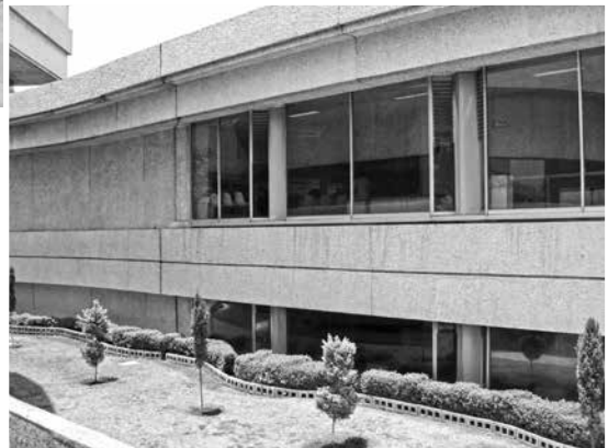
Imágenes exteriores de la clínica Fotografía: JCT, junio de 2007