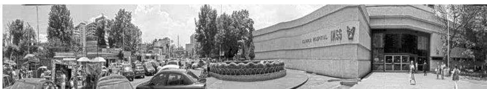
Paneo del exterior de la Clínica (T1). (deformación de origen)