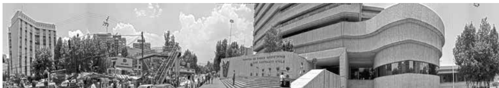
Paneo del exterior de la Clínica de Gineco-Obstetricia. (deformación de origen) Fotografía: JCT, junio de 2007