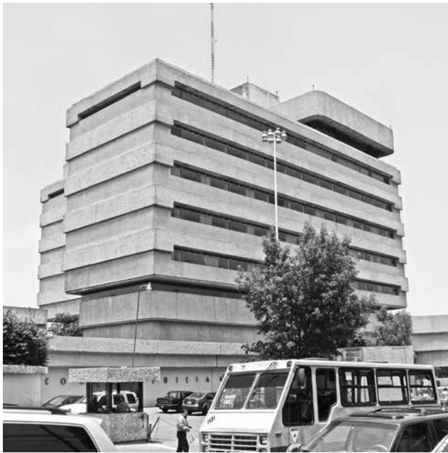
Clínica de Gineco-Obstetricia. Fotografía: Juan Carlos Tellez (JCT), junio de 2007

Las formas que utilizó tiende a la masividad horizontal, lo cual se acusa por la silueta de las ventanas a modo de tiras corridas que dibujan líneas en movimiento, que conforme avanzan de izquierda a derecha, asumen una forma ondulante que curva en la periferia de ambos edificios; a su vez, circundados por accesos también ondulantes, con jardines, pequeñas explanadas y escaleras monumentales.