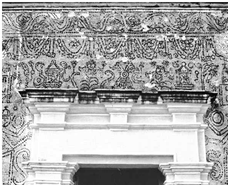
Imágenes de águila bicéfala, figuras humanas y faroles, en el mismo templo al diablo, en Tehuiloyocan, Puebla. Imagen extraída del mismo libro, pag.100.

y desafiante. Siempre ha existido el gusto por el mal ya que el mal da poder, atemoriza y finalmente esclaviza. Durante el virreinato el diablo estaba más presente en los consejos y sermones de los sacerdotes y monjes, además que se rozó con la visión maniquea, el bien y el mal como iguales pero siempre Cristo venciendo al mal.